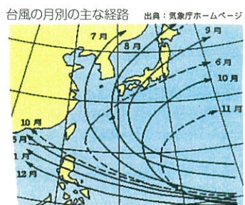
(実線は主な経路。破線はそれに準ずるもの)